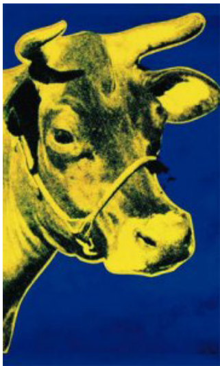
"Yellow cow on blue" Andy Warhol

Tapizada en cuero con pelo de Holando Argentino b&n, con detalle de tachas plateadas y ribetes en cuerina azul. Patas laqueadas a mano.